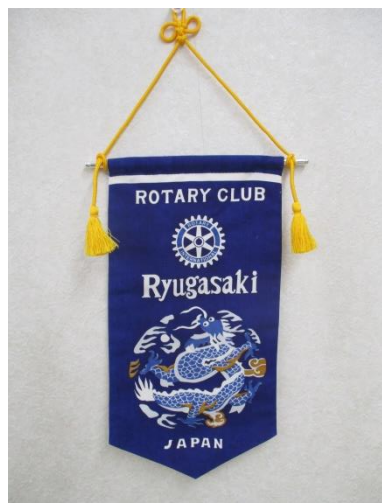
竜ヶ崎ロータリークラブのバナー

9 月号には第 7 分区クラブのバナーの紹介が掲載されます。それに先立ち、我が竜ヶ崎ロータリークラブのバナーの由来を紹介致します。