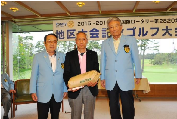
豪華賞品を手に3ショット