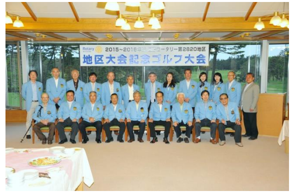
皆さん、お疲れ様でした