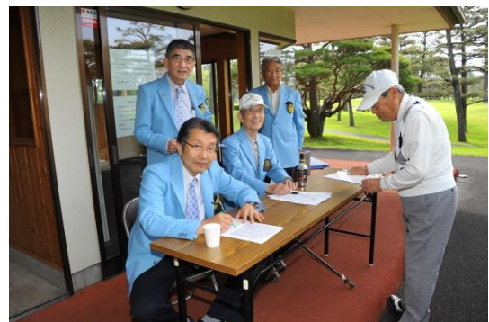
プレーヤーは緊張、受付担当はリラックス?!