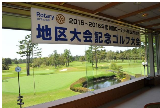
豪華な案内の看板