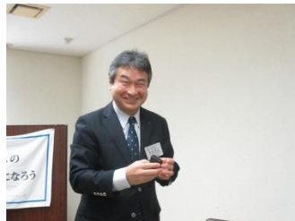
ホー・ルハリスフィロ+2ピソ 菊地君