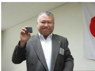
ホー・ルハリスフィロ+1ピソ 阿部君