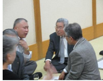
何やら怪しげな密談？