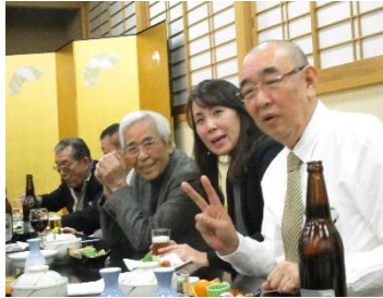
横一線に並び良い感じ