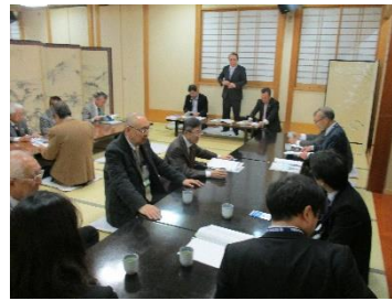
真剣そうな？クラブ協議会