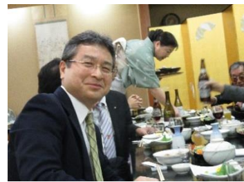
何か良い事があったはず。