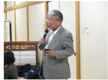
久々に我がクラブに御大登場！