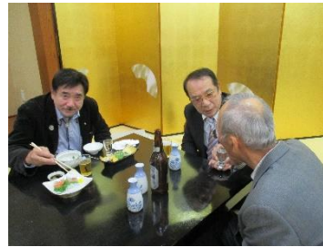
公式訪問の対策会議？