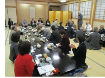
いつもながら和やかな懇親会