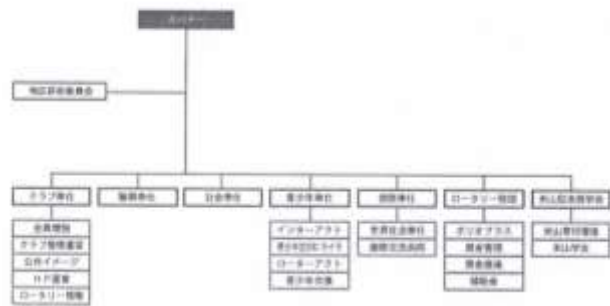
RI第2820地区 2018-2019年度 地区組織図